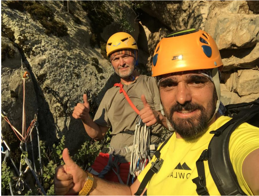
İlk ip boyu istasyon